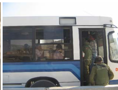
Soldater stiger på en buss för att med vapen i hand kontrollera alla passagerare.