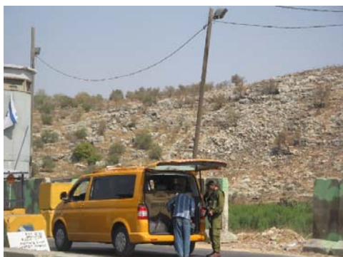
En taxi söks igenom vid Anab checkpoint.

skrattar, lyssnar på musik, har trevligt. Där sitter du i din bil, tiden går och du kan ingenting göra. Ingenting! För säger du till soldaterna att snabba sig kan du hamna i fängelse eller i värsta fall bli skjuten.