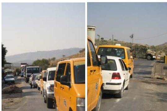
Bilkö vid Anab checkpoint. Längst fram står en militärjeep i vägen.

När tillfälle bjuds brukar jag försöka prata med soldater som tjänstgör vid någon av de tre checkpoints som finns runt Tulkarem. Alla är inte intresserade av samtal med ”internationella” som jag, ganska ofta får jag höra att jag ska försvinna därifrån. Men ibland blir det riktiga samtal, om Israel-Palestinakonflikten och hur båda sidor drabbas av den.