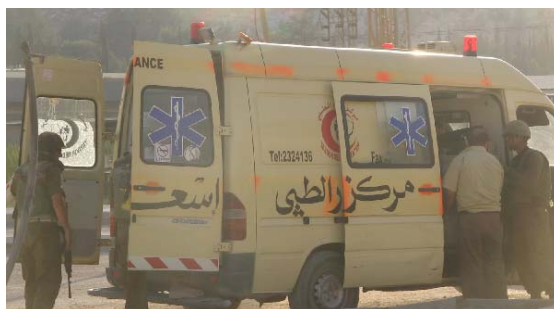
En ambulans söks igenom av soldater innan den får passera checkpointen på väg mot sjukhuset.