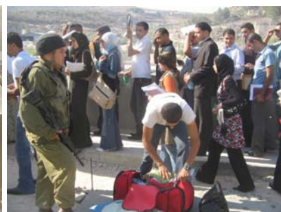
Väskkontroll. Unga män stoppas mest frekvent och får tömma ut allt innehåll i sina väskor på marken, övervakade av en soldat.

Att bevaka checkpoints har blivit en del av min vardag. Ändå har jag svårt att beskriva hur det är att vara där. Inga ord kan förmedla den spänning som finns i luften, stressen och aggressiviteten som blandas med ovissheten om vad som ska hända härnäst.