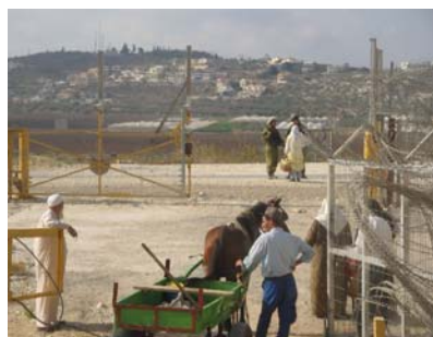
En annan form av checkpoint, en jordbruksgrind som bönder måste ha särskilt tillstånd för att få gå igenom till sin mark på andra sidan stängslet. Marken och stängslet är på palestinskt område.